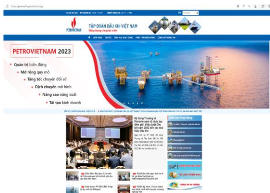
Webiste chính thống của Tập đoàn Dầu khí Việt Nam sử dụng tên miền quốc gia “.vn” (pvn.vn)